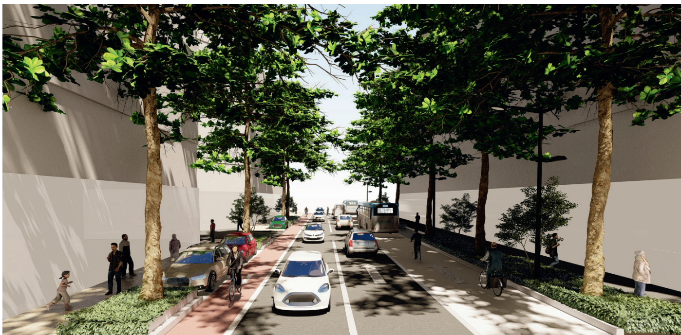
vue projetée de l'avenue Salengro requalifiée